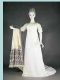
シュミーズ・ドレス 1800-05 年頃

1789年に起こったフランス革命。歴史の転換点になり、ファッションにおいては過剰な造形や装飾が捨て去られ、自然なスタイルへと急激な変化を見せます。フランス皇帝ナポレオン・ボナパルトによるフランス第一帝政にちなんで「エンパイア・スタイル」と呼ばれるこの時期のファッションを、版画や映像なども含めた数々の収蔵品より紹介します。