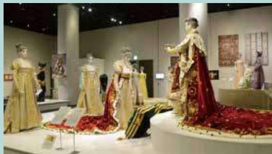
皇帝ナポレオン一世戴冠式の再現（展示風景）

1789年に起こったフランス革命。歴史の転換点になり、ファッションにおいては過剰な造形や装飾が捨て去られ、自然なスタイルへと急激な変化を見せます。フランス皇帝ナポレオン・ボナパルトによるフランス第一帝政にちなんで「エンパイア・スタイル」と呼ばれるこの時期のファッションを、版画や映像なども含めた数々の収蔵品より紹介します。